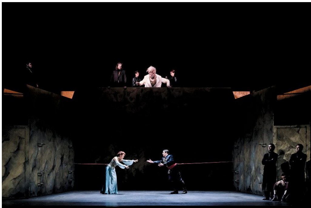
La Flûte enchantée dans la mise en scène de Johnny Bert à l'Opéra du Rhin.